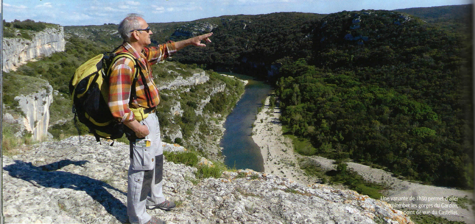
Une variante de 1h30 permet d'aller surplomber les gorges du Gardon, au point de vue du Castellat.