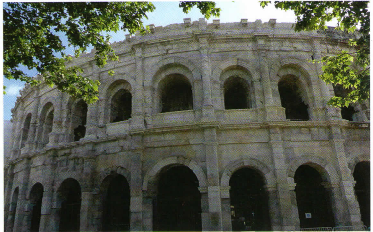
Dans sa partie urbaine, le chemin passe près des Arènes de Nîmes.

XII e , on construit la cité médiévale fortifiée, retrace Noémie Machefer-Delamatta, qui assure des visites pour l'office de tourisme. Un système féodal se met en place avec des co-seigneureries. Sur le chemin de Régordane, on contrôle les routes et les flux de voyageurs ».