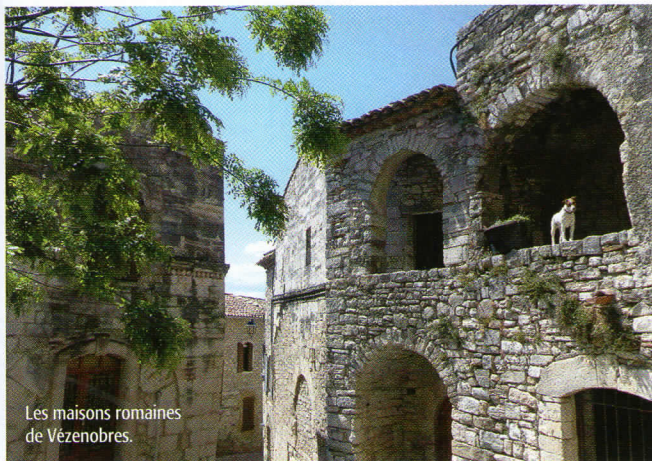
Les maisons romaines de Vézénobres.